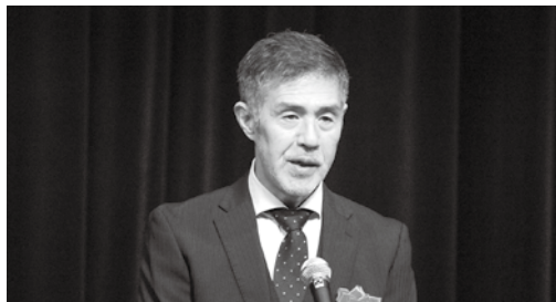
直方労働基準監督署 宮崎署長