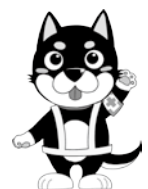
トヨタ自動車九州（株） 安全・健康キャラクター あんけんくん